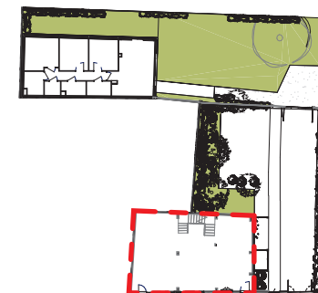
PLACE DES COMBATTANTS